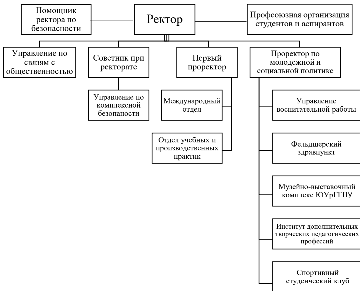
Рис. 1 Структуры университета, участвующие в реализации воспитательной работы

Подсистемами воспитательной системы ФГБОУ ВО «Южно-Уральский государственный гуманитарно-педагогический университет» являются: